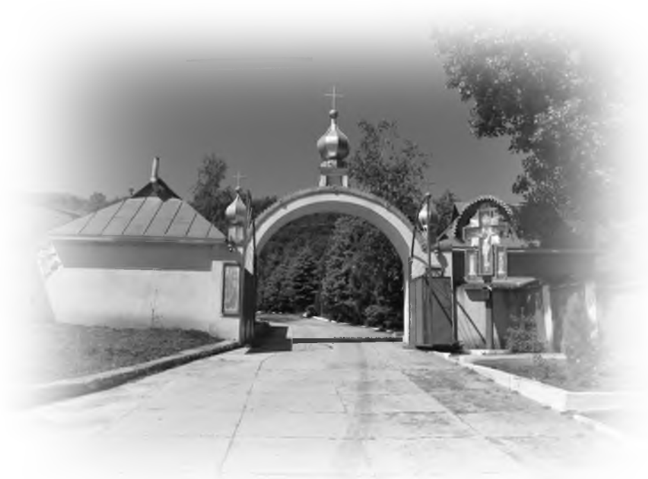
Poarta centrală a mănăstirii Japca, 29 mai 2014.

„Să ne ajute Dumnezeu Atotștiutorul să mergem cu smerenie pe calea strâmtă și spinoasă a vieții monahale pe care am ales-o și să trecem prin poarta strâmtă a vieții” Statutul mănăstirii de maici Înălțarea Domnului din Japca