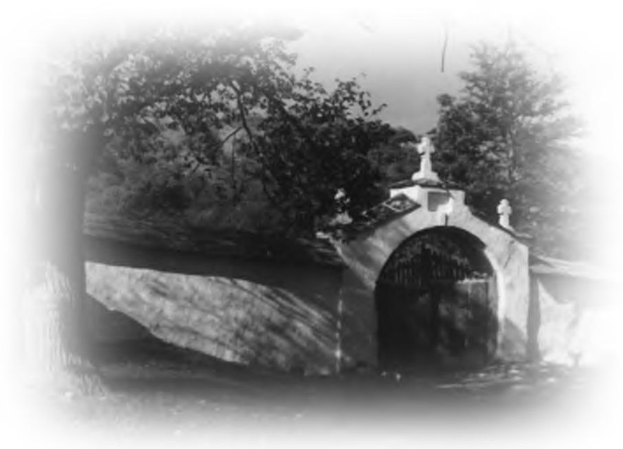
Una din porțile mănăstirii Japca, 1948.

„Împărăția Cerurilor se ia cu străduință și cei ce se silesc pun mâna pe ea” Matei 11:12