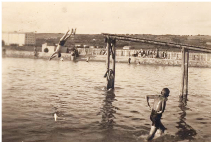
Fig. 2. Ștrandul lui Bivol (în partea stângă, pe fundal, se văd depozitele Fabricii de Tutun), anii 1930.