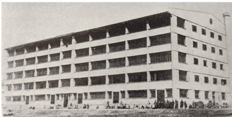
Fig. 1. Depozitul de fermentare a tutunului din Chișinău, anii 1930.